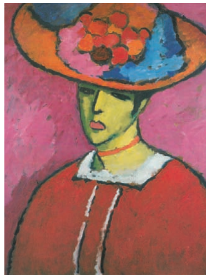
„SCHOKKO“, c. 1910., rano razdoblje, 75 x 65 cm

Nakon slikanja horizontalno položenih pejzaža, Javlenski je počeo slikati serije djela koje je nazvao „Variationen über ein landschaftliches Thema“ („Varijacije na temu krajolika“). Prve od tih slika okomitog formata pokazuju upravo ono što je vidio sa svog prozora: put s grmljem koji vodi do jezera, nekoliko kuća i visoki bor pokraj njih. Pojedini elementi krajolika ubrzo postaju ovalnim ili okruglim površinama boja. Premda predstavljaju objekt, one postupno gube svoju opisnu ulogu pa tehnika nijansiranja postaje novim područjem eksperimenta.