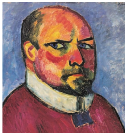
„AUTOPORTRÉT“, 1911., rano razdoblje, 55 x 51 cm

Iz druge knjige kataloga „Catalogue Raisonné of the Oil Paintings“, koju je objavila izdavačka kuća Sotheby's Publications, slijedi prijevod i obrada odabranih dijelova eseja pod naslovom „Serijsko slikarstvo Alexseja Jawlenskog“