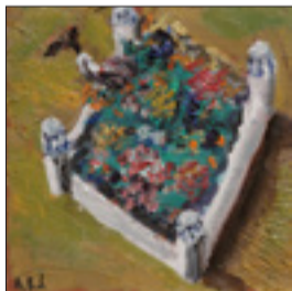
Perivoj istoka, ulje na platnu, 20 x 20 cm, 2021.

na devu ili vazu. Dakle, oblak isporučuje taj fenomen figuralnosti koji koristim. S tim se ljudi susreću na brojnim mjestima oko sebe. Započne se u gatanju taloga crne kave. Umjesto figurativnog ja isporučujem figuralno i tako se približavam Danteovu tekstu i književnom govoru. Ne kao Rački i drugi naši slikari, ne uljenom slikom, ne crtežom, već digitalnom tehnikom u formi klasične grafike. Čitajući paralelno Čistilište i naslage na mojim slikama, nalazite i lik Svevišnjeg, Dantea i Vergilija. Zrnate strukture namaza boje uspješno glume nesretan narod sabijen u strepnji i mucu. Fotografirane postaju plijen piksela glasnika suptilno raspakirane beskonačnosti. Ono što podcrtava povijesnu distancu od Dantea jest gotovo dadaistički i ready-made -princip uz mogućnosti brojnih drugih tumačenja, npr. nadrealističkih i plazmatičkih nahođenja.