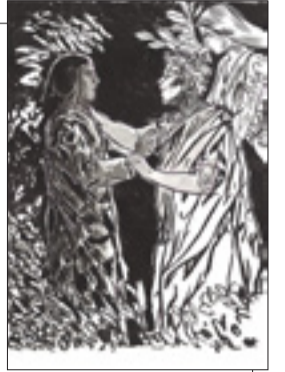
Susret s Vergilijem, papir / tuš – crni, 28,3 x 21 cm, 2021.

teove smrti likovno obilježiti novo književno izdanje vlastitim doživljajem te čudne šetnje krugovima straha i užasa izgubljenih duša, koja nikad ne gubi na aktualnosti. Umjetnička kreativnost voli se naslanjati na nesiguran put s očekivanjem, na zanimljiv način doživljenim, sretnim krajem. Nakon ponovnog čitanja Pakla Dante mi se čini zanimljivijim – on je aktualan i uzbuđljiv u susretu s tamnom stranom ljudske naravi, no naravno s jasnom nadom u svjetlost. Nakon ovoga „paklenog“ iskustva dobio sam volju svojim crtežom proći čistilištem i rajem.