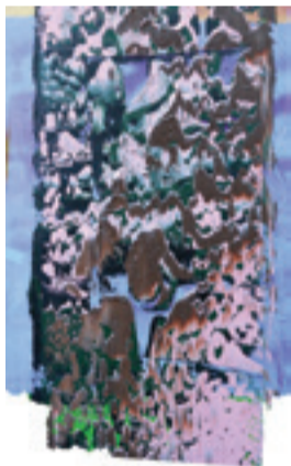
Čistilište 2, art-print, 45 x 32 cm, 2021.

mene oduvijek bili izrazito likovnog karaktera, pri čemu mi je najbliža bila Delacroixova slika Dantea i Vergilija kako prelaze rijeku Stiks – ona mi i danas lebdi pred očima. Premda sam najnovijim radovima oživio svoje prvo čitanje Dantea, ne mogu reći da sam čitajući ga ponovno otkrio išta novoga prema onome što sam već znao o njemu, ili možda to nisam htio pustiti k sebi. U radu sam žrtvovao dosta vlastita likovnog identiteta usmjeravajući ga prema ilustraciji, dok su drugi kolege zadržali svoj osobni idiom. No pritom sam nastojao ne iznevjeriti svoje slikarske stavove, a to može biti i pozitivno i negativno jer sam tako ostao negdje na pola puta. Mnogi su se moji prijatelji također čudili kako sam ja, čije je slikarstvo dionizijsko i optimistično, vedro, prepuno svijetlih boja, prihvatio izazov interpretacije Pakla . Ali baš sam ga zato prihvatio, jer u protivnom ne bi bila riječ o izazovu.