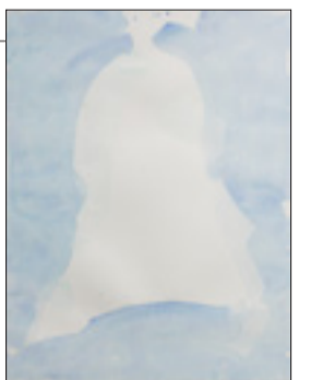
Himna blaženih (XXIII. i XXVII. pjevanje), akvarel i olovka, 28,4 x 37,2 cm, 2021.

U tom lebdjenju kroz „laka tijela“ Danteovih stihova pronašao sam način (simboli i simboličke slike) i likovna sredstva (olovka i akvarelna boja) „predočenja“ raja – osjećanje vedrine, prozirnosti i radosti; radosti koja izlazi iz istine o Božjoj ljubavi, koju svjedoči i kojom je sav prožet Danteov svestremeni spjev, naglašeno suvremen i po poruci o važnosti vjere koja jedina čovjeka i čovječanstvo vodi pravim putem.