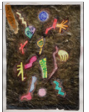
Čistilište 8, kombinirana tehnika, 34 x 25 cm, 2021.

ni sve treba pročistiti kako bi se došlo do smisla ili besmisla. Kosmos, odnosno svemir, čak ni on ne bi imao smisla da nije stvorio inteligenciju koja može razmišljati o njemu. A tada znanost slavi bit postojanja, gotovo paradoksalno dokazujući i postojanje Boga. Istodobno je razočaravajuće i tužno to što živimo u ostacima svijeta – u fazi čistilišta, a da toga nismo ni svjesni. Stoga je umjetnost čudo mističnog povjerenja i razotkrivanja ljudskog bića, što je religiozan čin pa se opet vraćamo ljubavi kao izvoru svega dobra na ovome svijetu.