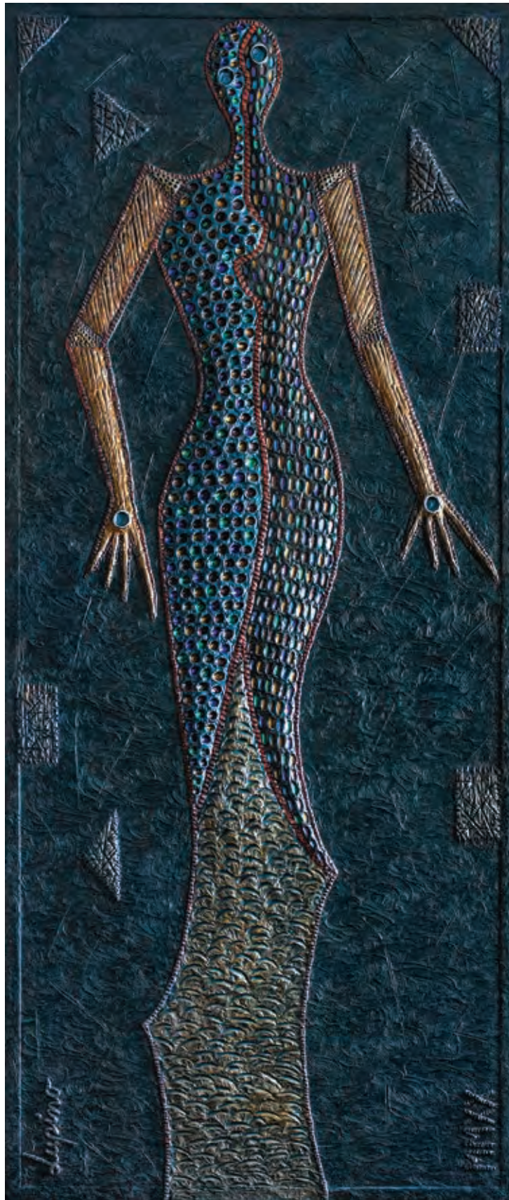
Stephan Lupino, Ondine (prije: Lady Corona – autoričina interpretacija umjetnika je potaknula preimenovati seriju ženskih likova nadahnutih pandemijom koronavirusa), akrilna masa na drvu, 171 x 71 cm, 2020.